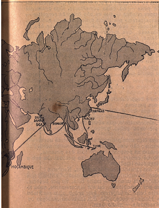
...rer a Brigada Cine-Portuguêsa

...as as belêsas das ...ntinuando a rece- ...valiosissimas ade- ...ção do grande filme ...al Maior,, e para a ...volta do mundo ==