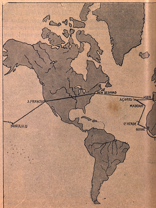
Esboço do percurso que se pr

propõe-se filmar nossas colónias, ber numerosas sões para a pro "Atravez do Port = sua excursão